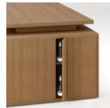
Скрытая ниша с внешней стороны тумбы

С внутренней стороны тумба имеет три одинаковых ниши, в любую из которых можно установить стандартную мобильную тумбу с тремя ящиками (без колёсных опор), сейф, офисный холодильник; остальные две ниши можно комплектовать полками и дверцами, оснащенными системой открывания "push". Внешняя сторона тумбы имеет скрытую нишу, оборудованную полкой и дверцей с системой закрывания "push". Торцевая часть тумбы выполнена в виде ниши с полкой, которая может быть укомплектована дверцей, оснащенной системой закрывания "push".