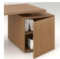
Ниша с дверью в торцевой части тумбы

Тумба имеет три выдвижных ящика, оборудованные центральным замком. Левая боковая сторона тумбы (вид со стороны пользователя) имеет скрытую нишу, оборудованную полкой и дверцей с системой закрывания "push". Торцевая часть тумбы выполнена в виде ниши с полкой, которая может быть укомплектована дверцей, оснащенной системой закрывания "push".