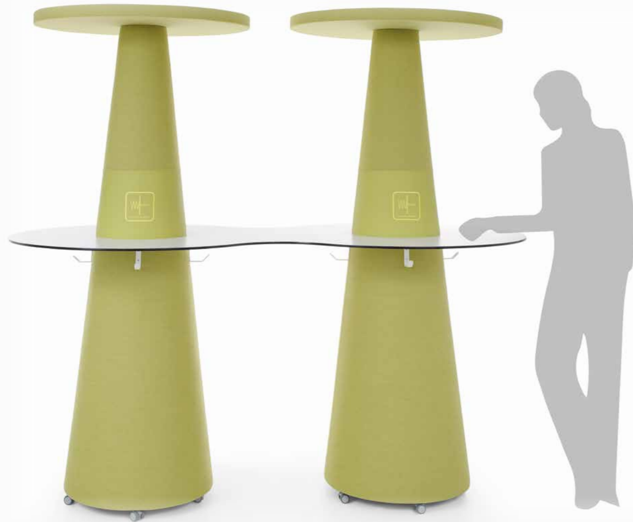
APTW + AP CT2T + 2xRF