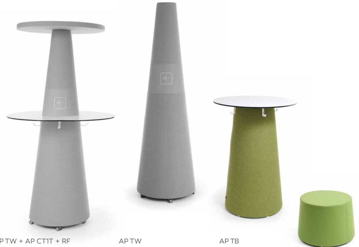
APTW + AP CT1T + RF

EN | Glass, concrete, metal – these materials dominate in every modern office building, at the same time disrupting the interior acoustics. One of the solutions for this problem are minimalist, innovative, and having unprecedented acoustic properties sound absorbers ACOUSTIC PEAK, that will effectively silence any interior.